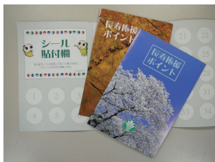
長寿応援ポイントシール貼付台紙